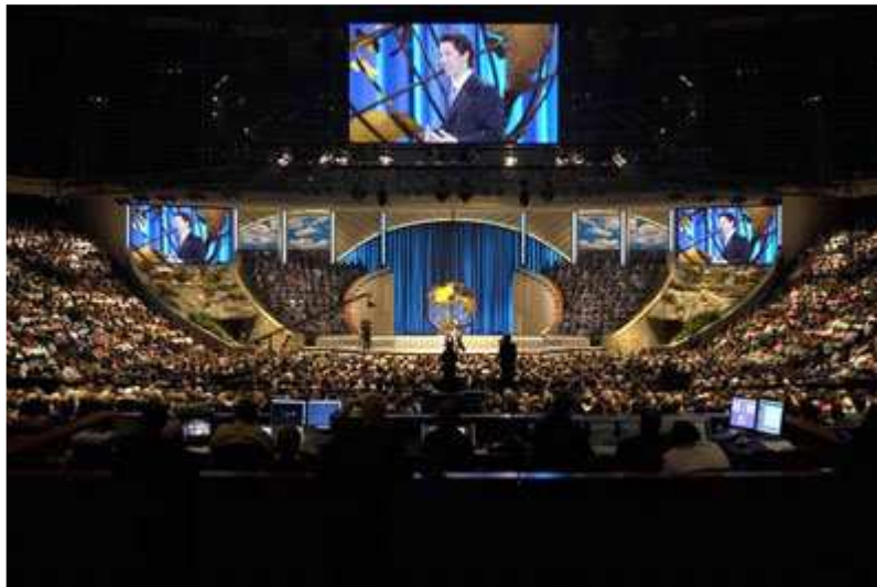
Joel Osteen nella colossale Lakewood Church

Uno dei principali protettori del "messaggio positivo", della "confessione positiva", "pensiero positivo", "ottimismo senza limiti" è senza dubbio alcuno Joel Osteen, il pastore della congregazione più grande degli Stati Uniti, Lakewood Church, a Huston, Texas.