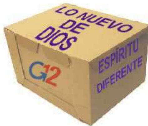
Le cose nuove di Dio?

Quando si dice che Dio sta facendo “qualcosa di nuovo”, dobbiamo presupporre che le “cose vecchie di Dio” debbano essere scartate. Ciò nonostante, Dio non ha niente di “vecchio”. Quello che è stato, è lo stesso di quello che è ora ( Ecclesiaste 1:9-10 ).