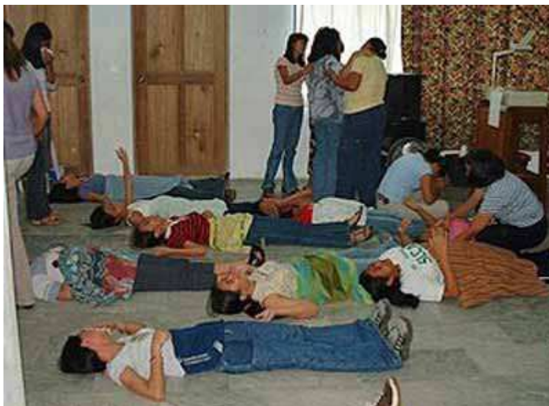
Dove incontriamo nella Bibbia questa pratica?...e non serve che dicano che “queste sono le cose nuove di Dio”

Essere inebriati nello “spirito”, è pratica comune in tutti gli “incontri”. Non possiamo immaginare Gesù Cristo e i suoi discepoli caduti a terra, “ubriachi” nello spirito. Semplicemente, ciò non è in accordo con la Parola di Dio, la quale ci esorta a fare tutto “ma ogni cosa sia fatta con dignità e con ordine” (1 Corinzi 14:40).