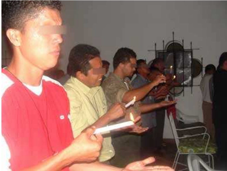
“Letteralmente bruciandosi per le anime”

Per dare un esempio al riguardo, la pratica di bruciarsi le mani con la cera ardente di una candela, per rappresentare che fa male “conquistare un’anima” per Cristo, è una pratica che non si attua in Nicaragua, perché gli organizzatori capiscono che non sarebbe accettata, e tuttavia, si realizza in certi settori dell’Honduras dove, sia per ignoranza biblica o sia per altra ragione, questa pratica in concreto è più che ammessa e praticata. Aggiungiamo una foto al riguardo: