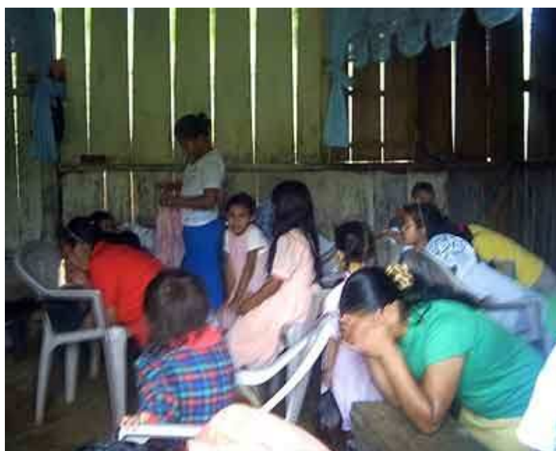
“L'interno del tempio dove si riunisce la piccola ma fervente chiesa”

Nel “ G12, Cronache del Nicaragua ”, ho scritto su questi “incontri”, ma in questo paragrafo continueremo a parlarne.