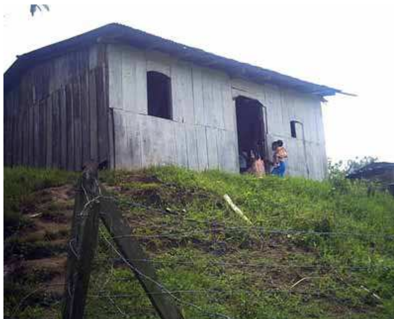
“Il tempio dove si riuniscono questi credenti “diseredati” dagli uomini, però certamente amati dal Signore”